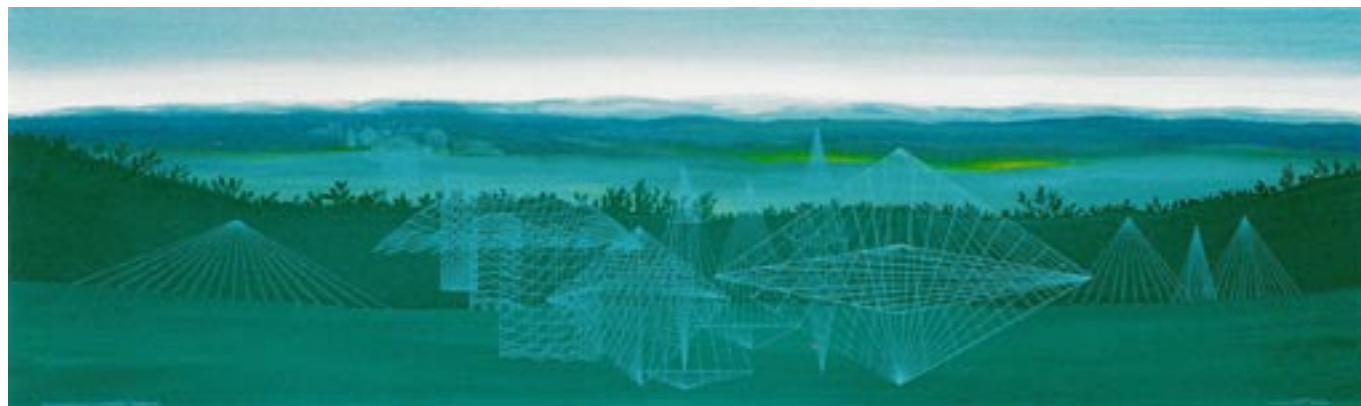
Panoramatická virtuální krajina, 2002, akryl, lak, sololit 56x168 cm

V dnešní krizi uměleckého obrazu nabývají na zvláštním významu ty malířské projevy, které kultivují vnitřní psychický obsah uměleckého díla. Obrazy Jiřího Kaloče jsou evokativní plochy, v jejichž barevném sfumatu vede transparence a zrcadlení symbolických představ k syntetické krystalizaci vlastního psychického vzpomínkového materiálu. Tato tajuplná cesta do nitra (Novalis) je malířským záznamem integrace umělecké osobnosti a autentickým projevem moderního českého lyrismu. (Petr Wittlich, 1997)