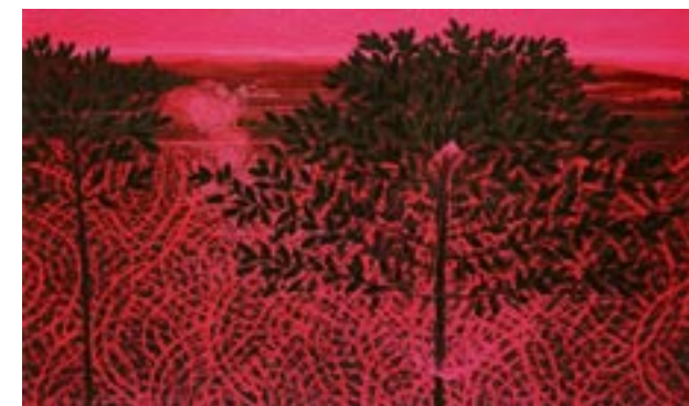
Tajemný podvečer II. – Zneklidňující a naplněná předtucha, 2006 - 2007 akryl, lak, sololit 122,5x204 cm