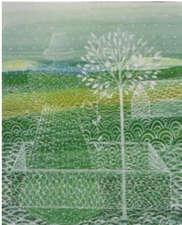
Loučení, 2006 - 2007, akryl, lak, sololit 30x23 cm