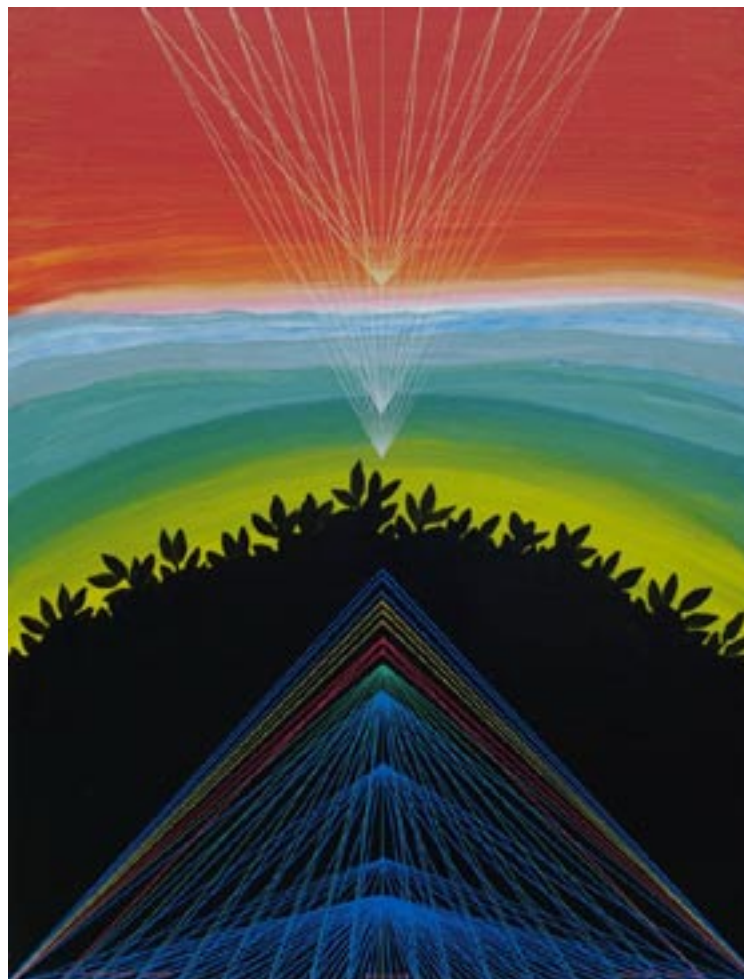
Pravděpodobné setkání, 2007 - 2008 akryl, lak, sololit 122,5x94,5 cm