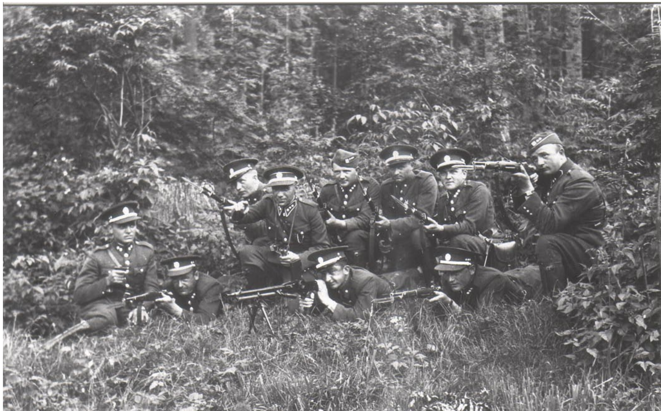
ODDÍL FINANČNÍ STRÁŽE BOŽANOV, 1938, dobová fotografie