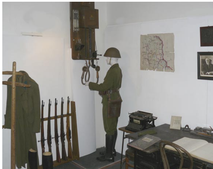
UKÁZKA INTERIÉRU ODDĚLENÍ FINANČNÍ STRÁŽE 30. LÉTA 20. STOLETÍ

U TELEFONU STOJÍ RESPICIENT FINANČNÍ STRÁŽE VE STEJNOKROJI DLE VLÁDNÍHO NAŘÍZENÍ 106/1938 SB. S VOJENSKOU PŘILBOU VZ. 32 JAKO PŘÍSLUŠNÍK SOS