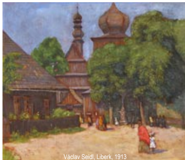
Václav Seidl, Liberk, 1913