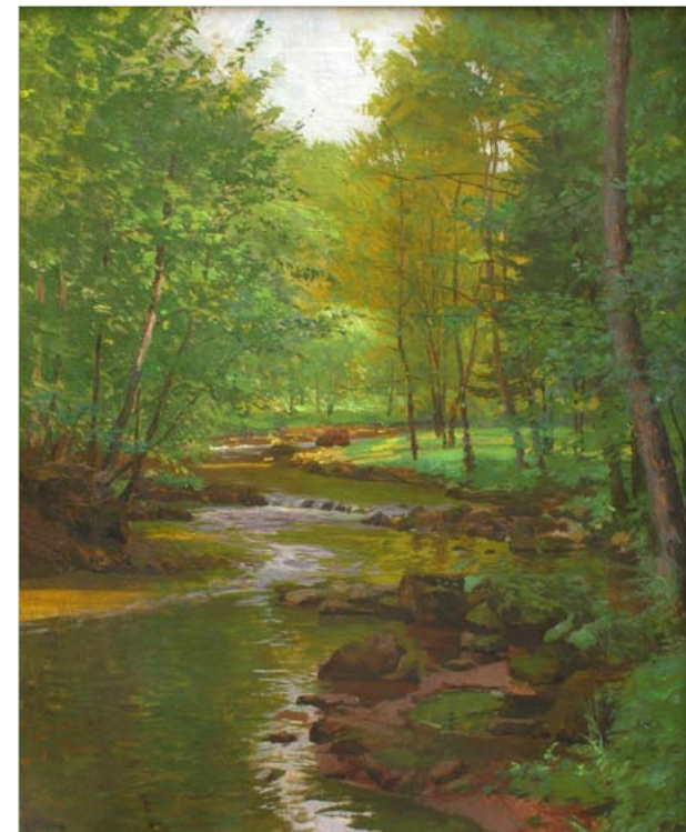
Oldřich HLAVSA, Partie na Zdobnici , 20./30. léta 20. století Olej na plátně, sbírka Aloise Tacla