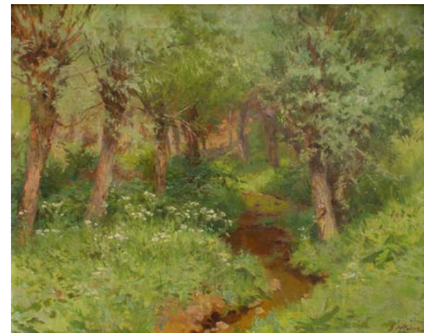
Oldřich HLAVSA, Vrby nad potokem , 20./30. léta 20. století Olej na plátně, sbírka Aloise Tacla