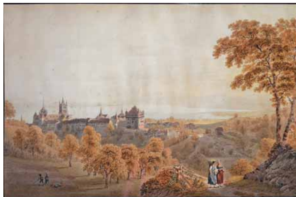
▲ GABRIEL LORY (* 1784 Bern - † 1846 tamtéž) POHLED NA LAUSANNE, 1806 Kolorovaný lept s akvatintou

Muzeum a galerie Orlických hor v Rychnově nad Kněžnou děkuje Janu Kolowratu Krakowskému za laskavé zapůjčení exponátů pro tuto výstavu.