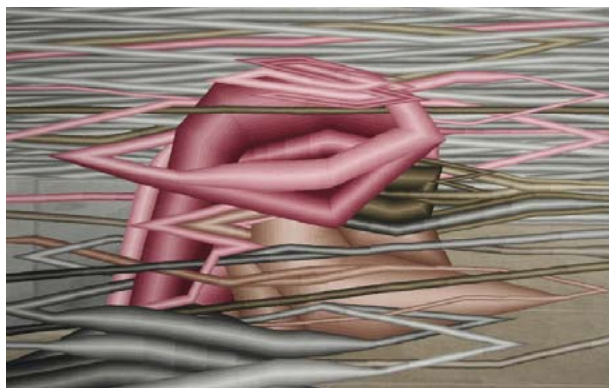
TRÁVA 4 , 2007, tapiserie 164×265 cm

Výstava je programovou součástí VI. Bienále české krajky ve Vamberku