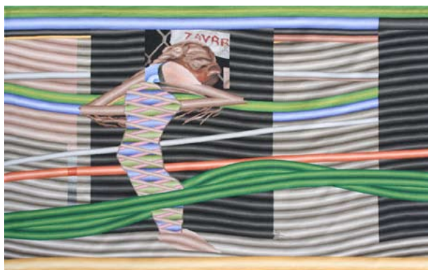
ZAVRR , 2010, tapiserie 142×231 cm