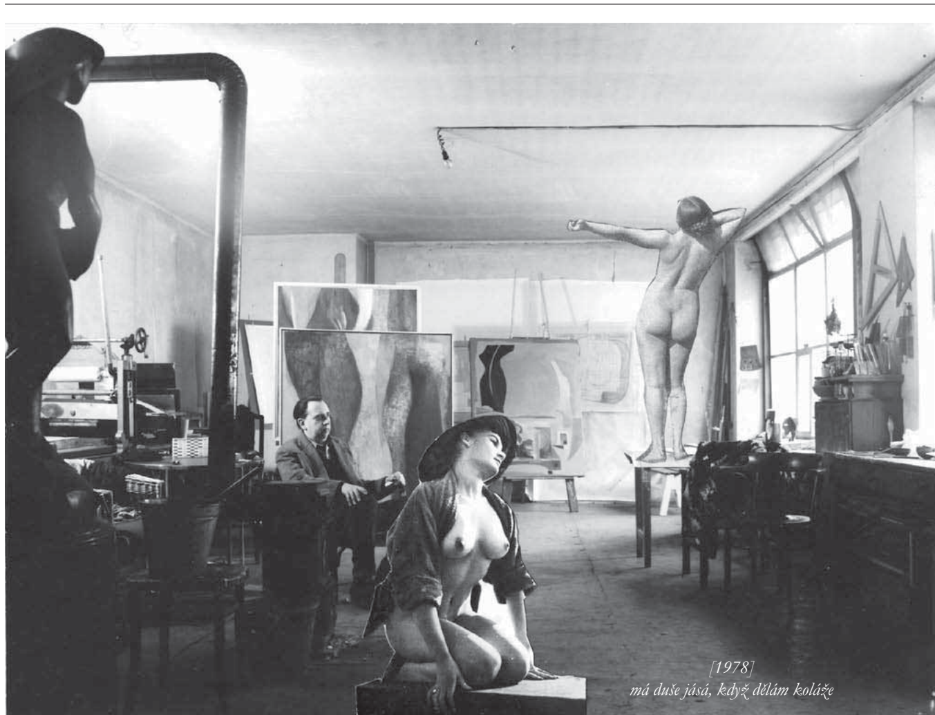
V ATELIÉRU 1983, koláž, papír

[1978] má duše jása, když dělám koláže má duše jása, když dělám koláže ukažte umění, který to dokáže když dělám umění, který se nemění duše se namáhá když dělám koláže, i když jsou pro vraba duše se pobaví a zhmotní postavy přitom si zrajásá, když dělám koláže ukažte umění, který to dokáže duše se překrčí duše se promění, když není umění pudy si jásají, když dělám koláže málokdy umění tohleto dokáže