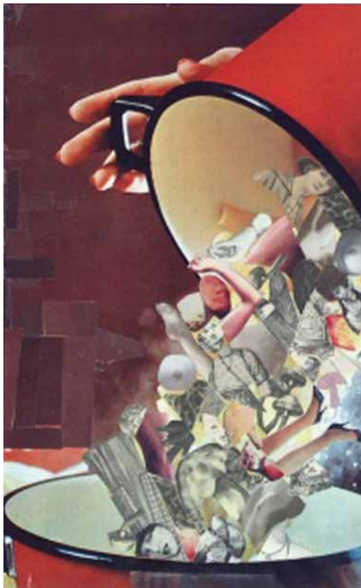
DÁMY NA HOUBÁCH 3 1977, koláž, papír

In: Jánuš Kubíček, Dramatický meziprostor, Brno 1995 (Petrov), 2004 a 2008