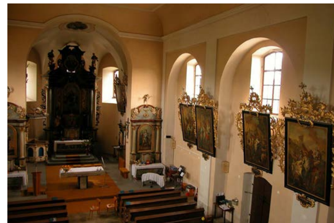
Původní umístění obrazů Křížové cesty v interiéru kostela Nanebevzetí Panny Marie v Orlici – Letohrad

První zpráva o existenci kostela Nanebevzetí Panny Marie pochází ze Soupisu far diecéze pražské, pořízeného za arcibiskupa Arnošta z Pardubic v letech 1344–1350. Pravděpodobně během husitských válek byl tento nejstarší kostel zničen a až někdy po roce 1450 vystaven nový, který sloužil místním obyvatelům českobratrského vyznání. Zvony tohoto kostela jsou datovány léty 1497 a 1498 a uchovaly se do dnešních časů.