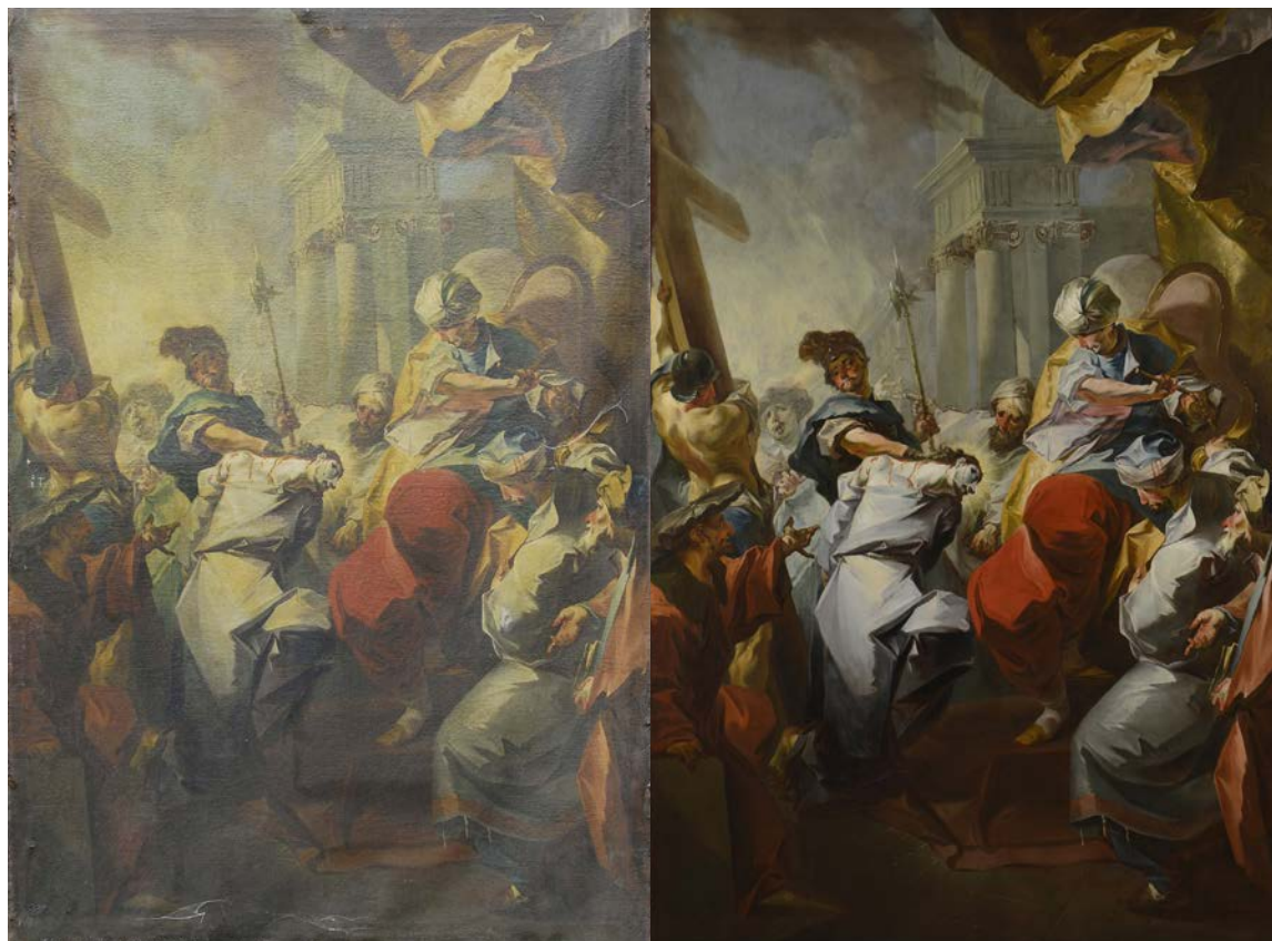
Jan Václav Bergl, Statio I. – Ježíš k smrti odsouzen Stav před a po restaurování, olejomalba 205x137 cm, 1759 Římskokatolická farnost Letohrad

II. patro Kolowratského zámku v Rychnově nad Kněžnou