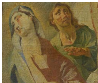
Jan Václav Bergl Statio XII. – Ježíš umírá na kříži Olejomalba 208x137 cm, 1759 Římskokatolická farnost Letohrad