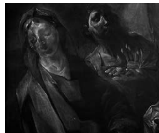
Na rentgenogramu se ve spodních vrstvách objevila významná autorská změna „pentimenti“, dokládající tvůrčí přístup malíře k zobrazovanému tématu.