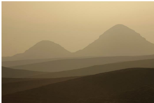
Abúsírské pyramidy od severozápadu

Otevřeno denně mimo pondělí 9 – 13 a 14 – 17 h v dubnu do 16 h tel.: +420 494 535 894 e-mail: moh@moh.cz www.moh.cz