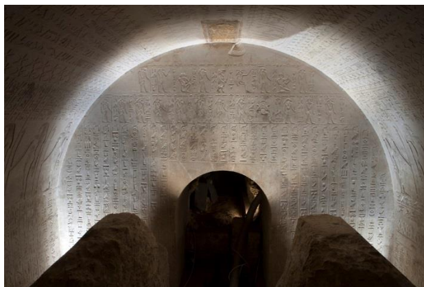
Pohřební komora Menekhibnekaovy šachtové hrobky

pracuje na několika lokalitách na území Egypta a Súdánu a přispívá tak k poznání počátků a rozvoje starověkých společností. Český (tehdy Československý) egyptologický ústav vznikl v roce 1958 přetvořením egyptologického semináře, který od 20. let 20. století fungoval na pražské filozofické fakultě. Počátky tohoto semináře jsou spojeny především se jménem Františka Lexy a později i jeho žáků a pokračovatelů Jaroslava Černého a Zbyňka Žáby. Archeologický výzkum přímo v Egyptě ústav započal v roce 1960 na dvou místech – v Abúsíru a svou účastí na mezinárodním záchranném projektu UNESCO, který měl za úkol prozkoumat a zdokumentovat památky Nubie ohrožených stoupajícími vodami nově budované Vysoké přehrady u Asuánu. Od roku 1976 ústav pracuje v na nové koncesi v Abúsíru a ve své práci se soustřeďuje na tři hlavní témata: výzkum královského pohřebiště doby Staré říše, výzkum v jižním Abúsíru, kde se nacházejí hrobky kněží a úředníků ze stejného období a také výzkum šachtových hrodek ze sasko-perského období. Ústav se ale také provádí intenzivní paleoekologický průzkum a ve své práci ve velké míře využívá moderních metod a interdisciplinárního přístupu. Ústav ale svoji činnost rozvíjí na lokalitě el-Hajez v oáze Bahréja v Západní poušti a v Súdánu, v oblasti Usli a Sabaloky.