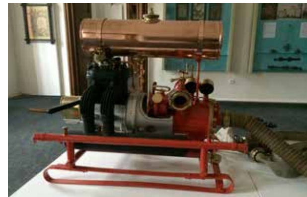
Motorová stříkačka SDH Plasnice z roku 1938.