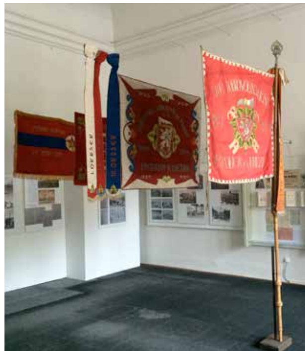
Soubor praporů rychnovských dobrovolných hasičů.

Impulem k uspořádání této výstavy byl velkorysý dar řady předmětů spojených s hasičskými dějinami, které do Muzea a galerie Orlických hor v minulém roce předali poslední dobrovolní hasiči z Rychnova nad Kněžnou. Ve městě nadále působí už jen hasiči profesionální.