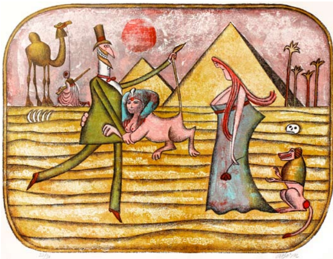
Nevhodně vybraný suvenýr, barevná litografie Sbírkový Galerie výtvarného umění v Havlíčkově Brodě