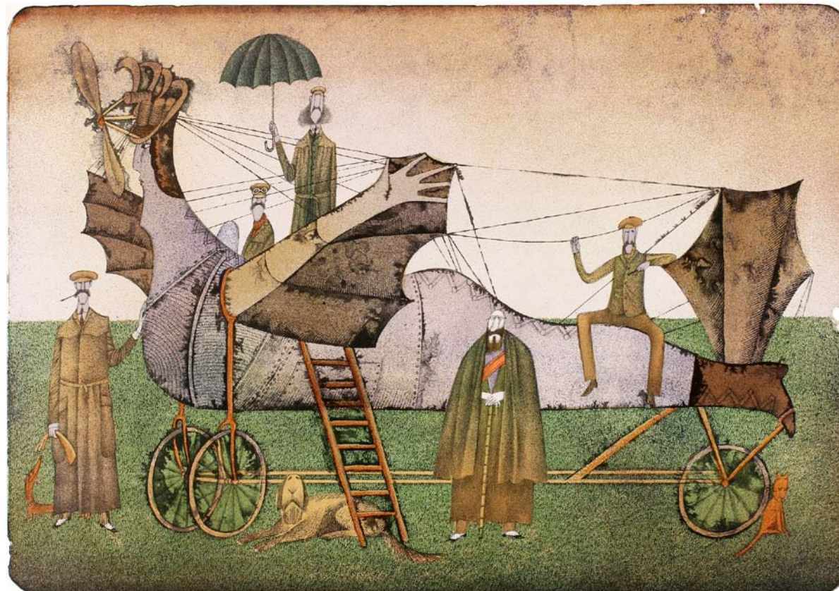
Let za každého počasí, barevná litografie Sbírky Galerie výtvarného umění v Havlíčkově Brodě