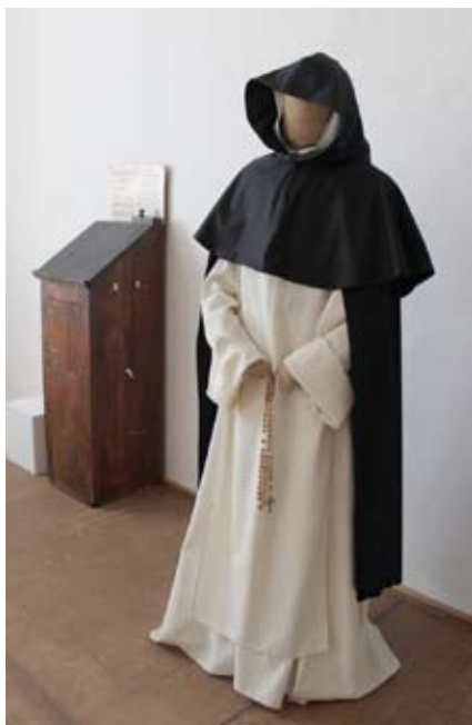
II. patro Kolowratského zámku v Rychnově nad Kněžnou

Pro zájemce o válečnou tematiku je připravena kolekce kvalitních replik zbroje a zbraní. Součástí výstavy je i gotická vitráž ze skleněných čtverců, pomůcky k pečetění listin, stolní hry a řada dalších zajímavých předmětů, které byly lidem v minulosti k užítku či potěšení. V klášterním skriptoriu jsou k dispozici seříznuté husí brky.