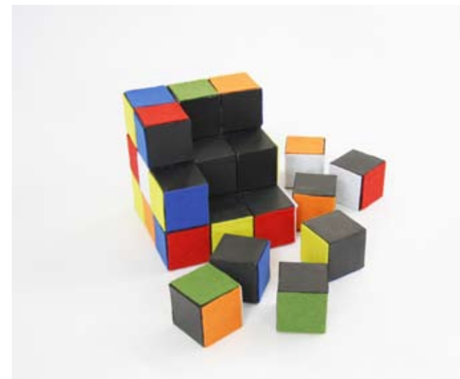
Eliška Řeháková, Miniatura, 2. ročník