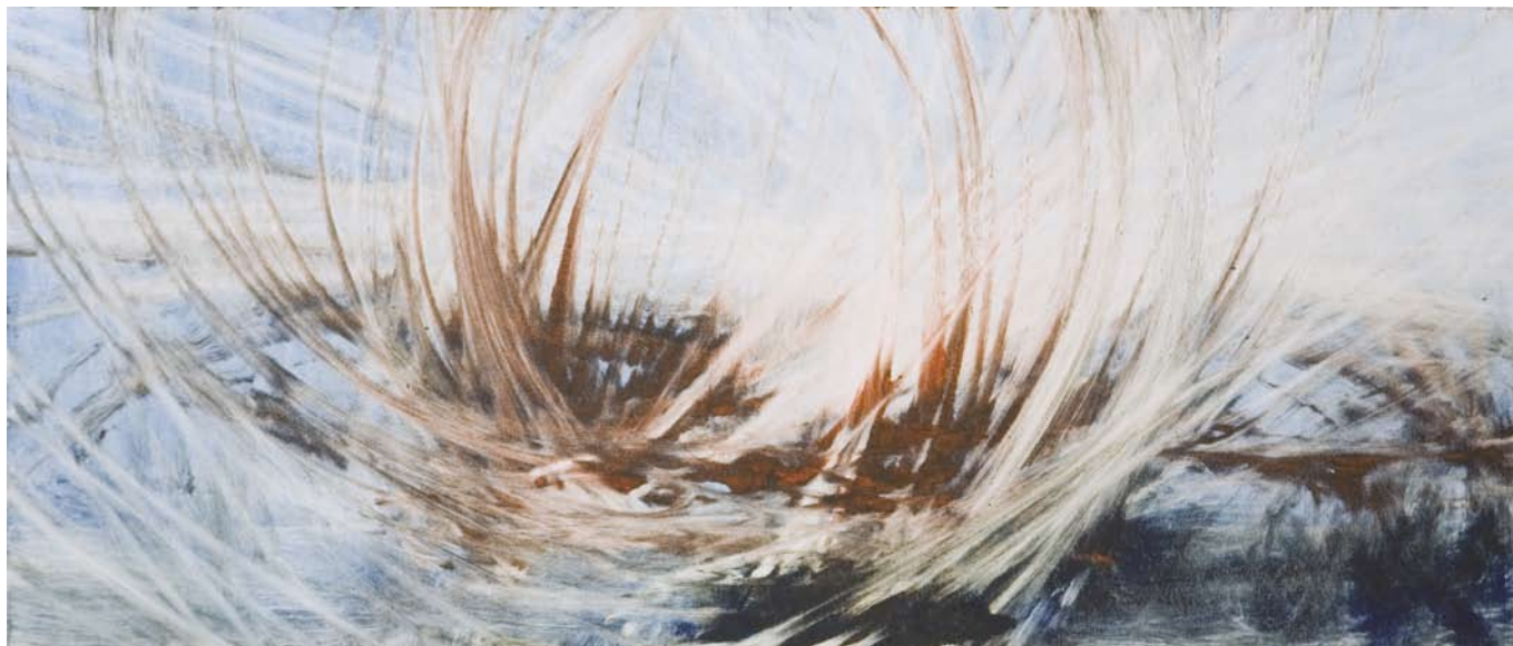
PŘÍBĚH KRAJINY - PŘEDJAŘÍ, 2009, monotyp, papír, 39,5 x 94,5 cm

V hudebním programu vystoupí flétnový soubor Sarabanda z Rychnova nad Kněžnou pod vedením Martina Šedy