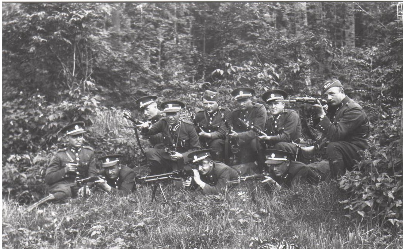
ODDÍL FINANČNÍ STRÁŽE BOŽANOV, 1938, dobová fotografie