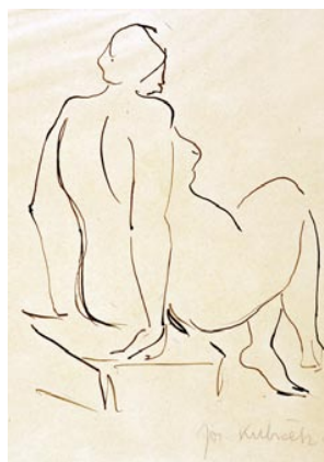
SEDÍCÍ ŽENSKÝ AKT S RUKAMA VZADU Nedatováno Tuš, pero, papír 345×210 mm