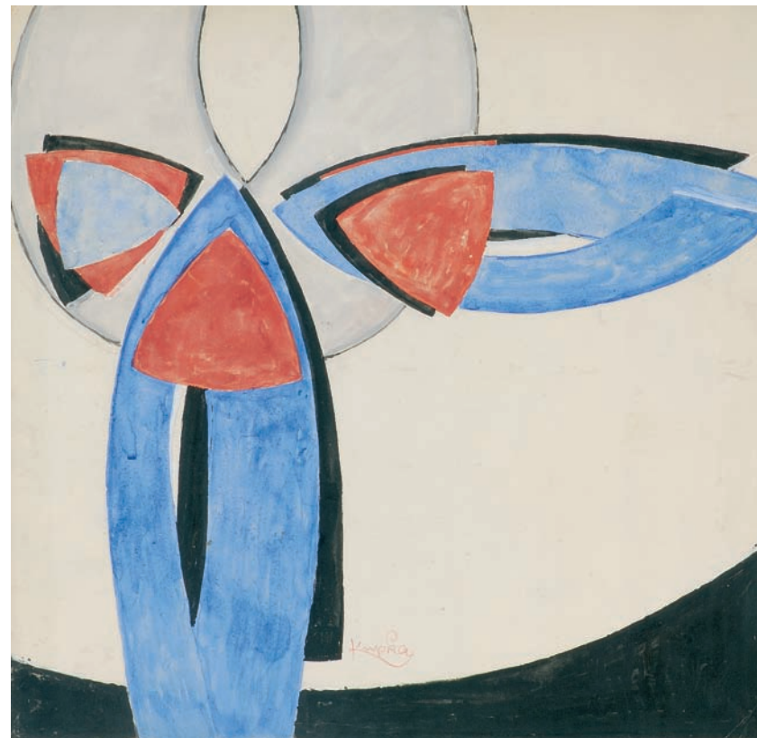
Studie k obrazu Amorpha, Dvoubarevná fuga, 1911–1912, kvaš na papíře

Info tel.: 494 534 015 www.moh.cz , galerie@moh.cz Výstava potrvá do neděle 11. září 2011 Otevřeno denně mimo pondělí 9–13 a 14–17 hodin