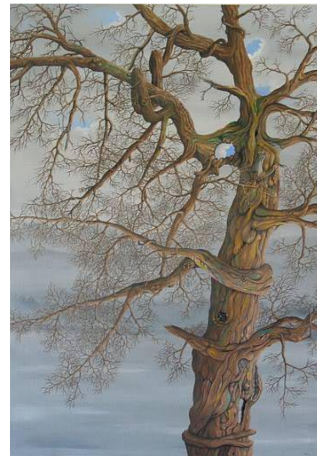
STARÝ STROM V ZIMĚ, olej na plátně 100×70 cm, 2005