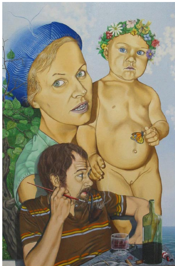
RODINNÝ PORTRÉT, olej na plátně 60×40 cm, 1977

„Od studentských let jsem miloval surrealismus, který přežil moderní umění i tady za mořem, kde nějaký čas žil Rudolf Plaček. Maloval obrazy pro svou krásnou ženu, která mu brzo umřela, a tak málokdo věděl, že v Torontu žije ten nádherný malíř. Když po pádu starého režimu věnoval časopis Revolver Revue jedno číslo přehlídce soudobé české malby, byl mezi nimi i obraz dvou nepodařených lidí na obrácené muchomůrce a u něho jenom „Autor neznámý“. Jenže my jsme o Plačkovi věděli a ten obraz jsme dali na obálku Bondyho Invalidních sourozenců.