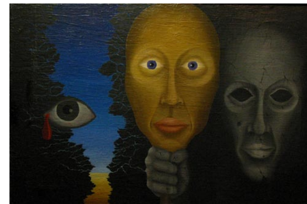
ODMASKOVÁNÍ, olej na plátně 40×60 cm, 1967

Josef Škvorecký, Toronto, v pátek 2. dubna 2010