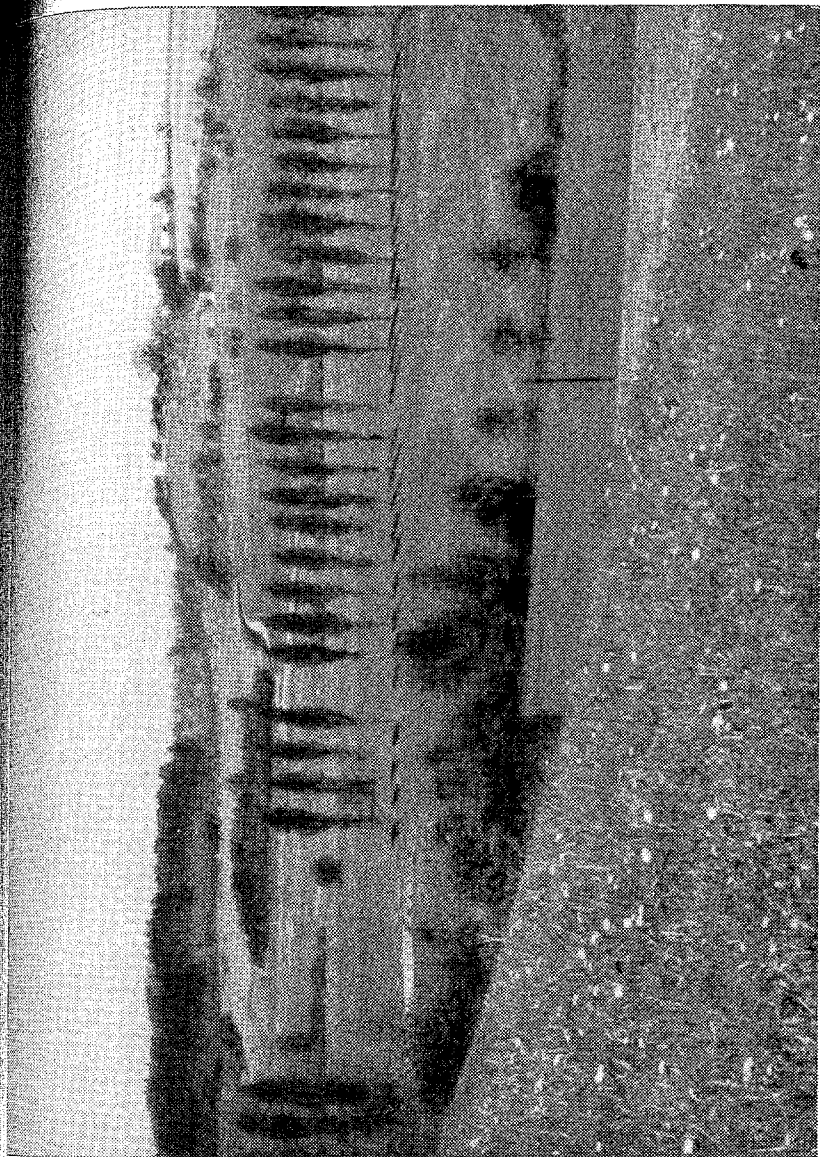
Edvalý panský dvůr Lhotka u Rychmova n. Kru.