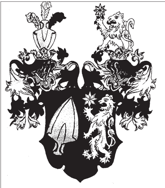
Obr. 2: Polepšený erb Hynka Jetřicha Vitánovského z Vlčkovice (kreslil Petr Doležal)