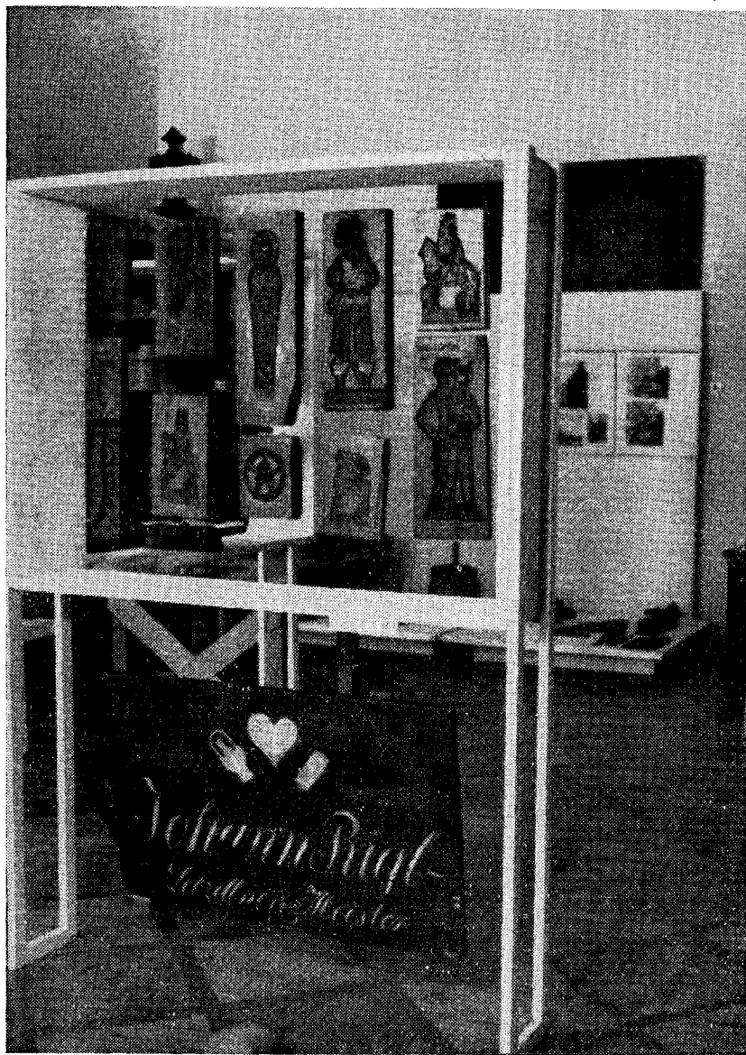
Z výstavy „Dřevo — obživa a krása“ v roce 1966—1967.