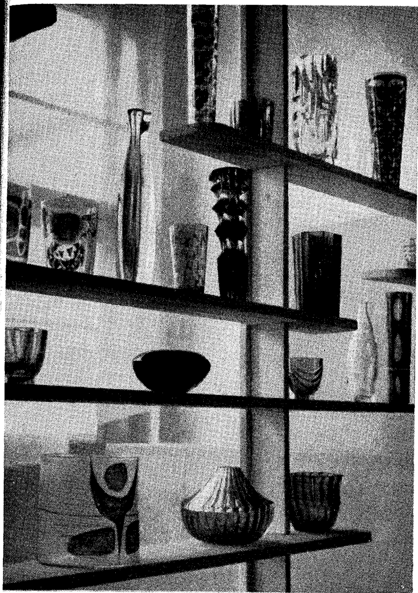
Z výstavy skla v Dobrušce v říjnu 1967.