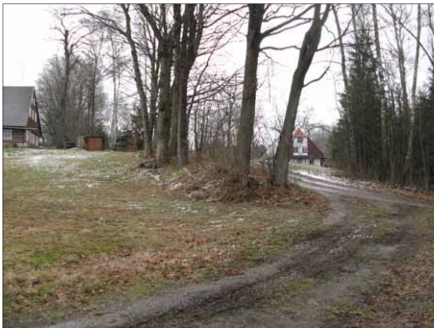
Obr. 5. Mezní pás v osadě Tisovec. Foto autor, 2009.

(Klášter nad Dědinou) roku 1803. 101/ Josef Vítězslav Šimák připisuje založení kláštera s ohledem na jeho malý majetek nějakému neznámému východočeskému šlechtici, dalšími badateli je jeho vznik spojován v souvislost s Vojslavou, jejíž jméno se zachovalo v nápisu vyrytém na kameni v severní zdi vysokoújezdského kostela. 102/