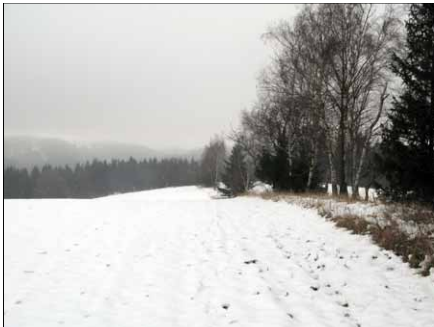
Obr. 6. Mezní pás Malého Uhřínova nad Benátkami. Foto autor, 2009.

považovat vizitace hradištského opata, jejichž provádění náleželo podle cisterciáckých statut vždy otci opatu mateřského kláštera. 106/ První opat ve Svatém Poli je písemně doložen ještě o dvacet let později k roku 1292. 107/ Již Josef Kurka na základě papežské odpovědi ve věci zásahu pražského arcibiskupa v roce 1381 do exempce českých a moravských cisterciáků soudil, že klášter Svaté Pole musel být založen nejdříve mezi lety 1252 až 1260. 108/ Pokládaje tedy založení svatopolského kláštera do padesátých let 13. století, usuzoval dále na základě položení klášterního zboží v sousedství pánů z Dobrušky Deštné v Orlických horách a svatopolský les mezi Bolehoští a Křivicí, že skutečnými zakladateli se mohl stát někdo z Půticů – předek budoucích pánů z Dobrušky, příšedších zhruba v této době do východních Čech z Plzeňska, kteří spolu přivedli několik mnichů z Pomuku, a společně s darováním území tak přispěli k tomu, že zde mohlo vzniknout řádné opatství. 109/ Podobně ovšem o něco později, konkrétně na rok 1273, respektive 1274, kladl vznik kláštera i Jaroslav Láska, jenž jeho založení připisoval předkovi pánů z Dobrušky Mutinovi Skuhrovskému, sedícímu v roce 1279 na Skuhrově nebo ještě pravděpodobněji jeho otci či tchánu Sezemovi z Kostomlat,