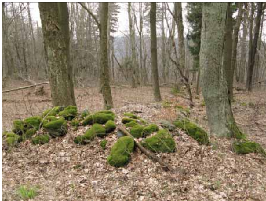
Obr. 4. Vrchol Bělá – situace v místě předpokládaného dvora.