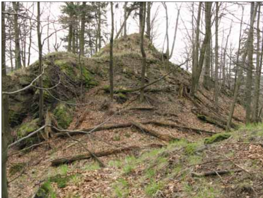
Obr. 9. Hlodný – celkový pohled přes šjíjový příkop. Foto autor, 2009.

stopami po vstupní brance důsledkem vyústění dnešní pěšiny stoupající po nejschůdnějším severním svahu nahoru do hradu. 168/