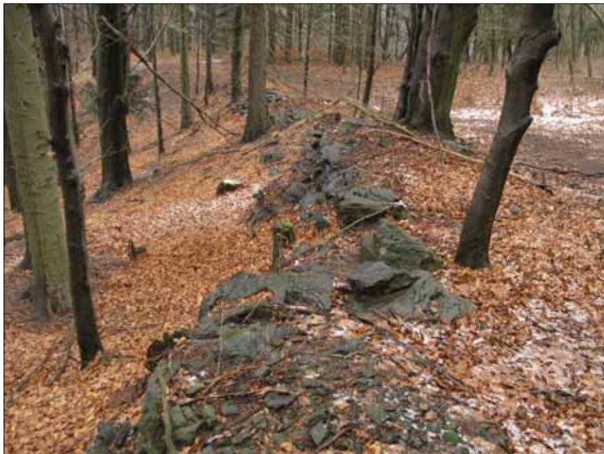
Obr. 2. Terasa na hraně svahu nad Hlodným.

objevující se roku 1176, jeden z prvních držitelů šlechtického predikátu, zemřel při třetí křížové výpravě v Palestině roku 1192. Zanechal po sobě dva syny, a to Oldřicha (1196–1216) a Protivu (1183–1219). 40/ Po Oldřichově smrti roku 1216 připadly Litice na Plzeňsku jeho bratru Protivovi, za jehož synů se rod rozdělil do dvou větví – litické a potštejské. 41/ Prvý ze synů Protiva (1235–1245) drží Litice na Plzeňsku a Žinkovy, druhý Půta (1254–1289) staví nad Žinkovami nový hrad pojmenovaný po sobě Potenstein. 42/ Příchod Půticů do východních Čech je kladen do vlády Přemysla Otakara II. či Václava II. 43/ Za prvního z Půticů přišedšího na Divokou Orlici považujeme Půtu, syna Půty z Křimic, který by na základě Sedláčkem uvedené zprávy, zmiňující k roku 1287 Půtu z Mladého Potštejna, mohl být zakladatelem Potštejna ve východních Čechách. 44/ Nevíme však, k jakému Potštejnu se přídavek mladý vztahuje, a tak za první prokazatelný záznam o východočeském Potštejnu považujeme údaj z roku 1312 dokládající pobyt Procka a Mikuláše z Potštejna (syn a vnuk zmiňovaného Půty) na Potštejně na Divoké Orlici v souvislosti se sporem mezi Potštejnou a pražskou patricijskou rodinou Pušů, do něhož se zapojili i další