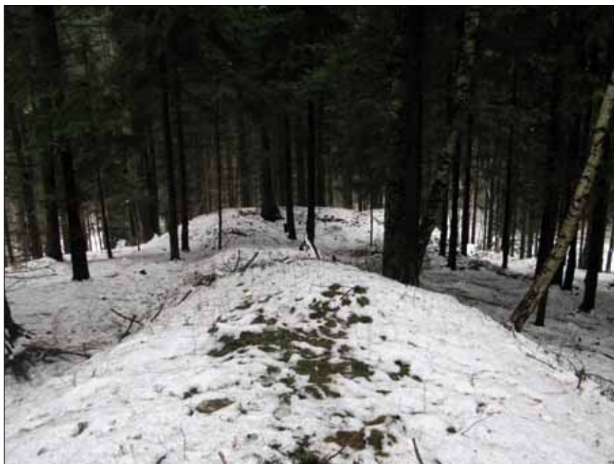
Obr. 8. Zalomení mezního pásu ve svahu údolí Kněžné u vsi Bukový. Foto autor, 2009.

Podobná situace se opakuje i v případě místa hledané středověké vsi u dnešního Tisovce. Zde celý úsek sleduje vrstevnice a kopíruje jejich zalomení v údolí drobné vodoteče. V dolní části pokračuje na protější svah pod hradem, v horní až na plochý vrchol Bělé nad Hlodný, kde je situace méně přehledná a kde předpokládáme existenci dvora. 145/