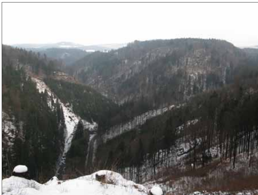
Obr. 3. Údolí říčky Bělé, vpravo stejnojmenný vrch s hradem Hlodným pod vrcholem.

účastníci. 45/ Tvrdé podmínky jeho vyřešení vyústily v loupeživou činnost Mikuláše, kterou zakončilo až roku 1339 dobytí Potštejna moravským markrabětem Karlem. O dva roky později v roce 1341 byla navrácena většina majetků (mimo Chocně a Potštejna) nejstaršímu Mikulášovu synu Ješkovi. V roce 1355 byl purkrabím na Potštejně jmenován Půta z Častolovic, který řídil jeho opravu. O rok později (1356) došlo k vykoupení potštejnského panství od Mikulášova syna Jana z Potštejna a jeho bratrů Karlem IV. 46/ a o další rok později (1357) daroval Karel IV. Čenkovi z Potštejna žampašské panství a Čeněk se stává předkem nového rodu Žampašských z Potštejna. 47/