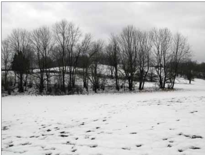
Obr. 7. Pohled na plužinu Bukového sbíhající se ke vsi.

činností. 141/ Podobné kamenné hromady jsou rozesety i na mnoha dalších místech. Se snášením kamene z polí počítáme v různé intenzivně prakticky po celou dobu zemědělského využívání pozemku.