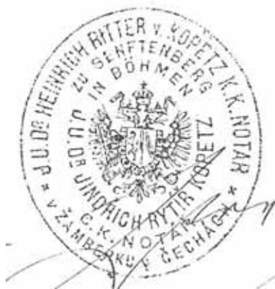
Obr. 1. Otisk úředního notářského razítka JUDr. Jindřicha rytíře von Kopetz.