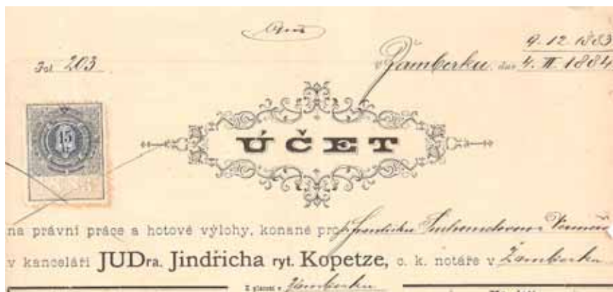
Obr. 4. Horní část účtu z roku 1884, použitého k úhradě notářských poplatků.