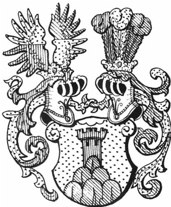
Obr. 3. Erb rytířů von Kopetz.