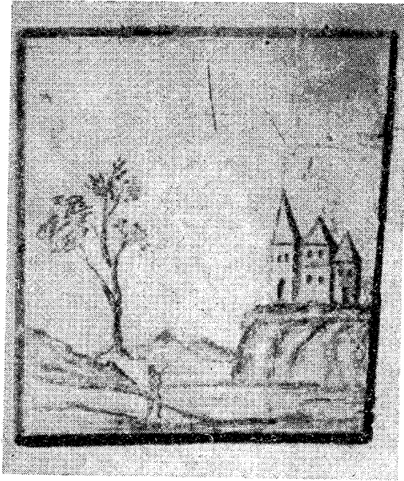
Nástěnná malba „modrého salónku“, domněle představující původní podobu skalecké tvrze (foto K. R. Krpata).

chosti. Komu to však stačí k závěru, že skalecká židovská pospolitost pozvolna chudla a že možná mezi zdejšími nebožtíky leží dnes nezjistitelný mladotovský hausjud?