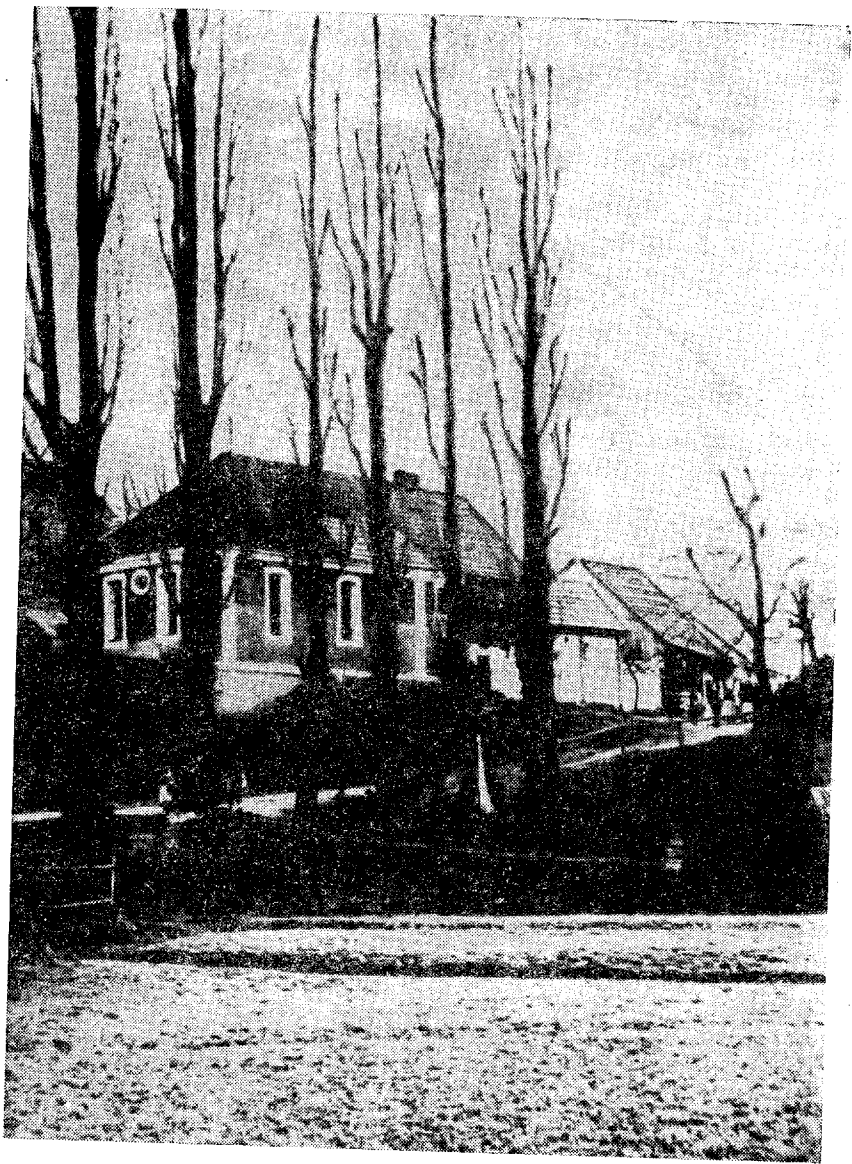
Původní vzhled skalecké synagogy před adaptací na chorobinec r. 1908. Topoly byly skáceny v r. 1893.