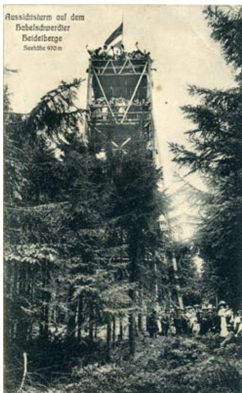
Fig. 2. Jagodna I – Otwarcie wieży widokowej na Jagodnej.