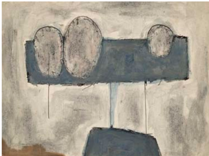
BEZ NÁZVU (1959-60) tuš, akvarel, tužka, papír GASK – Galerie Středočeského kraje, Kutná Hora