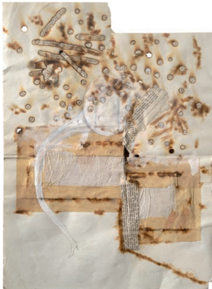
PARA MUSICA (1965) koláž, tuš, akvarel, vypalování, ruční papír, gáza GASK – Galerie Středočeského kraje, Kutná Hora