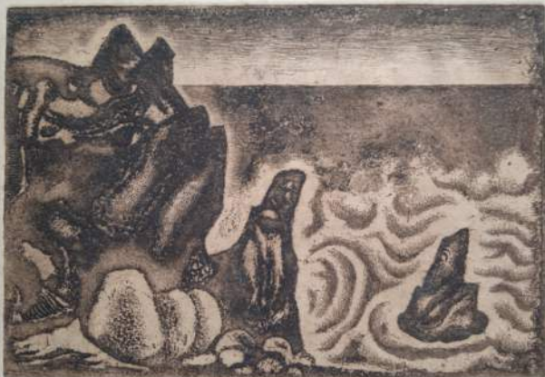
Orlická galerie a Hlavní výstavní sály muzea