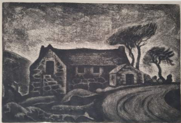
Orlická galerie a Hlavní výstavní sály muzea